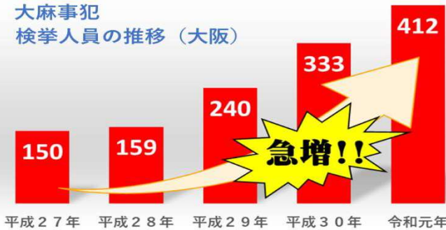
大麻事犯 検挙人員の推移（大阪）